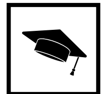
Personal von Universitäten