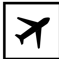
Arbeitnehmer im öffentlichen Verkehr

(ÖBB, Busse, Seilbahnen, Schiffe, Flugzeuge)