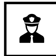
alle Beamten (z. B. Polizisten)

(ÖBB, Busse, Seilbahnen, Schiffe, Flugzeuge)