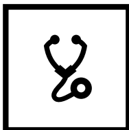
Gesundheits- berufe in Kranken- anstalten und Pflegeheimen

(z. B. Ärzte, Kranken- schwestern, Sanitäter, Hebammen)